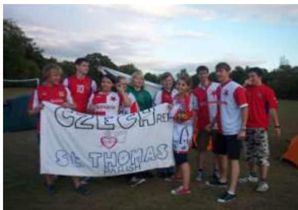
Setkání augustiniánské mládeže v Londýně