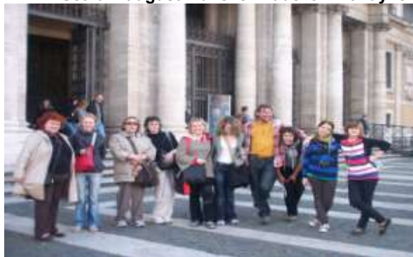
Pout' do Říma