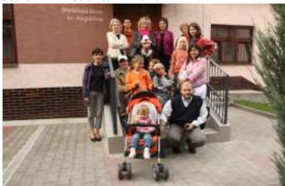
Školka sv. Augustina