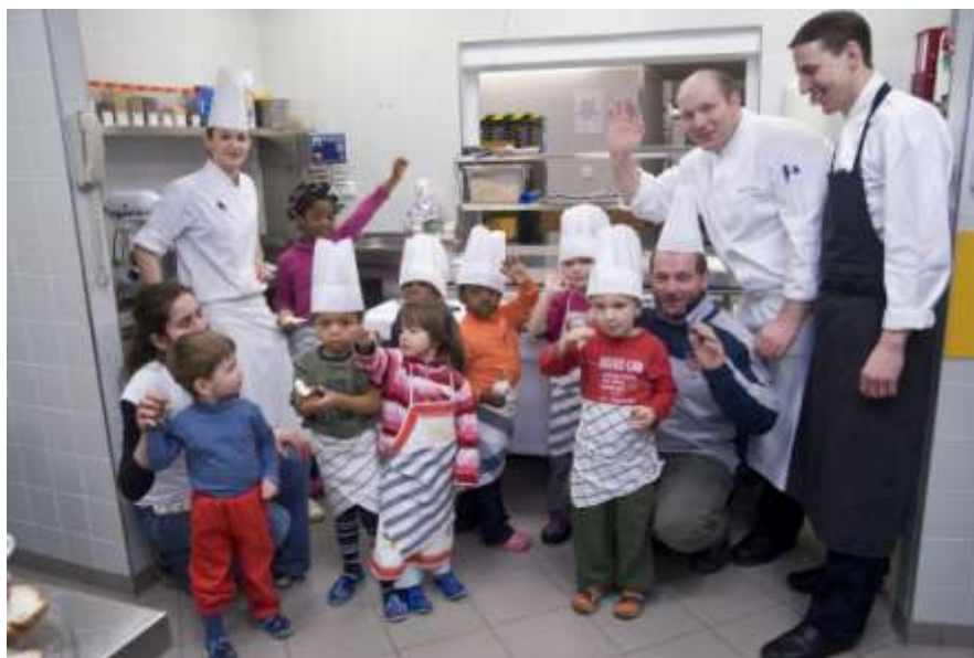
Pečení vánočních cukrovinek 16.12.2010. Hotel The Augustine

Rodiče mají možnost se podílet na sestavování plánů činnosti školy a svými podněty a nápady se zapojit do běžného života a chodu školy.