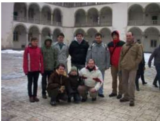
Setkání ministrantů – Krakov