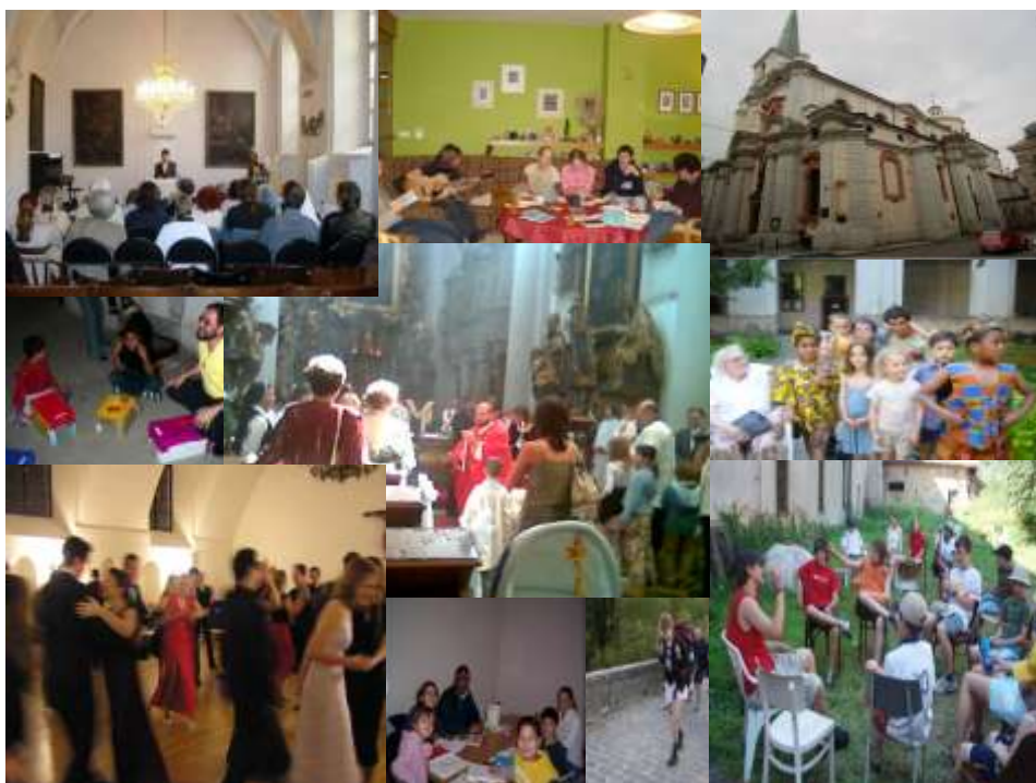
Kostel sv. Tomáše 4.-6. června 2010