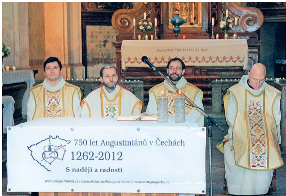
Augustiniáni slaví 750 let příchodu do Čech. Svůj zájem obrací spíše do budoucnosti.

Postupně vznikly další kláštery – Praha, Ročov, Bělá pod Bezdězem, Domažlice, Česká Lípa, Vrchlabí – v nichž řád podával svědectví apoštolského života a podílel se na rozšíření naděje evangelia. Je to 750 let evangelizace, prožívané a sdílené víry. Je to historie napsaná životem, a dokonce i krví mnoha bratrů, kteří zasvětili svůj život Pánu a zůstali věrní v jeho