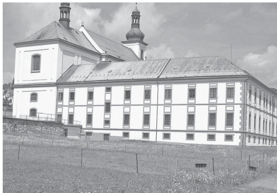
Vrchlabí – jeden z bývalých augustiniánských klášterů v českých zemích.