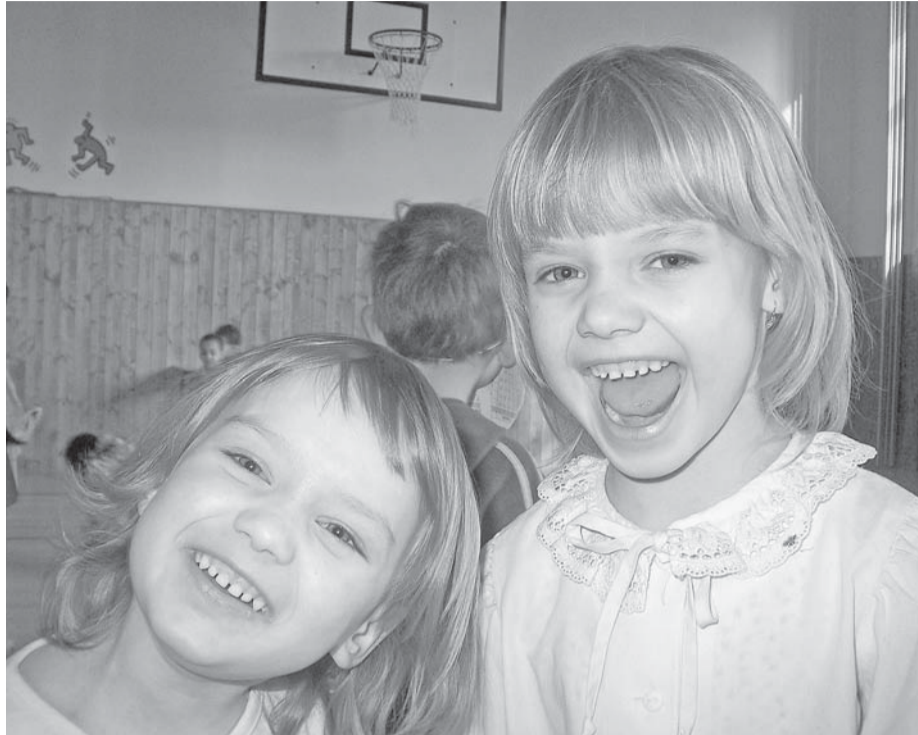
Farní slavnost je určena pro farníky a přátele kostela sv. Tomáše a augustiniánů. To znamená pro všechny.

Hlavní změna je po slavnosti, když spolu lidé strávili čas u her, u jídla a pití. Lidé mají čas se poznat a popovídat si a pak setkání mezi nimi během celého roku probíhají na jiné bázi.